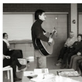
Open Mic & Praha 6 |