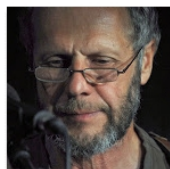
Open Mic POTRVÁ #73