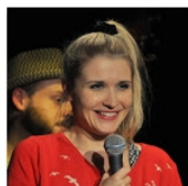
Open Mic POTRVÁ #71