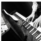
Open Mic POTRVÁ #73